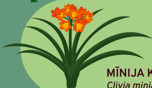
MĪNIJA KLĪVIJA Clivia miniata

Satur vielas, kas var izraisīt krampjus, vemšanu, samaņas zudumu, bīstami palēnināt sirdsdarbību.