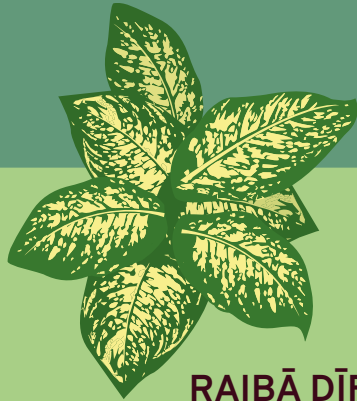
RAIBĀ DĪFENBAHIJA Dieffenbachia maculata

Augi satur kairinošas vielas un, nokļūstot acīs, rīklē vai uz gļotādas, var radīt spēcīgu dedzinošu sajūtu, apdegumus.