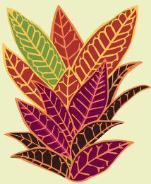
RAIBĀ KODIJA Codiaeum variegatum

Augi satur kairinošu šūnsulu, kas nonākot saskarsmē ar ādu un gļotādu, var radīt iekaisumu, kas līdzinās apdegumam.