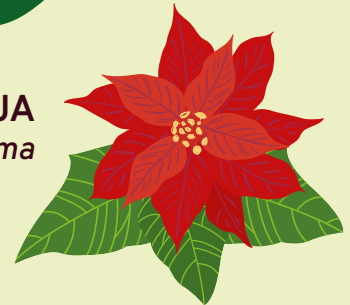
GREZNĀ EIFORBIJA Euphorbia pulcherrima

Augi satur kairinošu šūnsulu, kas nonākot saskarsmē ar ādu un gļotādu, var radīt iekaisumu, kas līdzinās apdegumam.