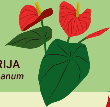
ANDRĒ ANTŪRIJA Anthurium andraeanum