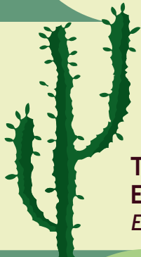
TREJŠĀUTŅU EIFORBIJA Euphorbia trigona